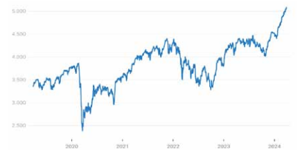
Euro Stoxx 50